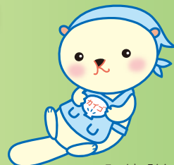
マスコットキャラクター「かいごん」